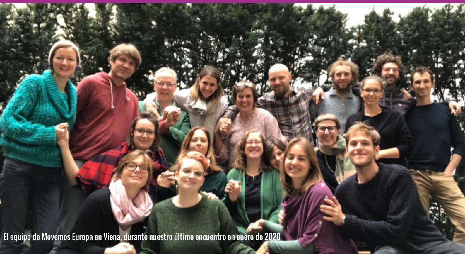
El equipo de Movemos Europa en Viena, durante nuestro último encuentro en enero de 2020

Descubre nuestras últimas campañas y participa en WeMove.eu/es/campañas